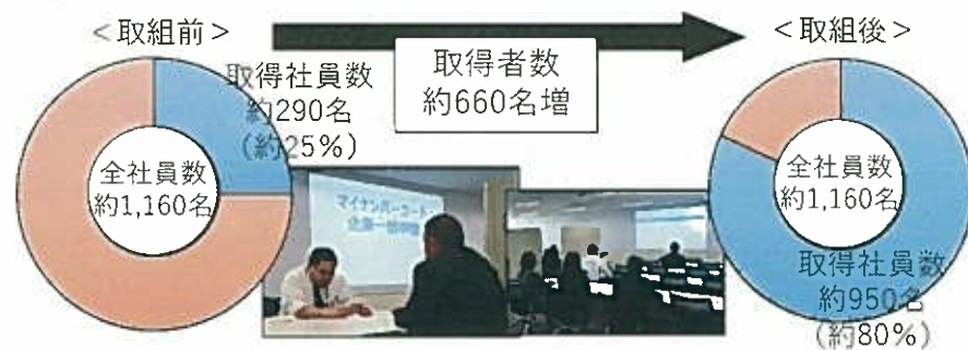
C社のマイナンバーカード取得状況